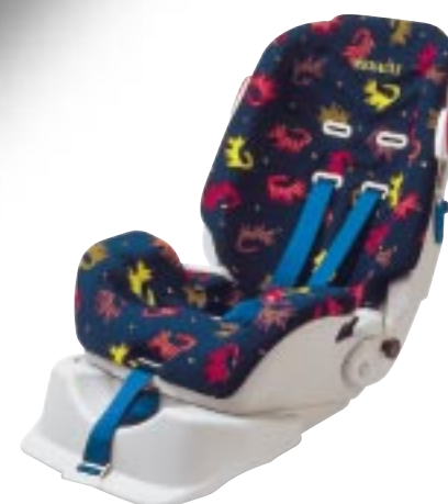
Sitz »Equation« Für Kinder von 9 Monaten bis 10 Jahren. Modular aufgebautes System mit optimalen Möglichkeiten je nach Alter des Kindes. Verwendungsmöglichkeiten: Rücken zur Fahrtrichtung: 9 Monate bis 3 Jahre. In Fahrtrichtung: je nach Zusammenstellung der modularen Komponenten 12 Monate bis 10 Jahre. Montage-Empfehlung: Rücksitz. 77 01 416 342 346,84 DM · 177,34 €