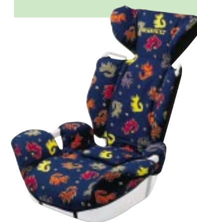
Sitz »Ergos« Für Kinder von 3 bis 10 Jahren Montage-Empfehlung: Auf dem Rücksitz. 77 01 416 346 84,80 DM · 43,36 €

Montage-Empfehlung: Auf dem Rücksitz. Befestigung der Kindersitze mit den serienmäßigen Dreipunktgurten. Bei Fahrzeugen mit Beifahrer-Airbag nur auf den Rücksitzen zulässig!