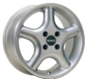
Design Pentaline 6 x 14"