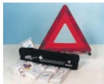
Rettungs-Set Verbandtasche, Bestückung nach DIN 13164130 inkl. Rettungsdecke und Warndreieck. 77 01 381 707 46,40 DM · 23,72 €