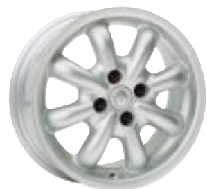
Design T-Line 5 1/2 x 14"