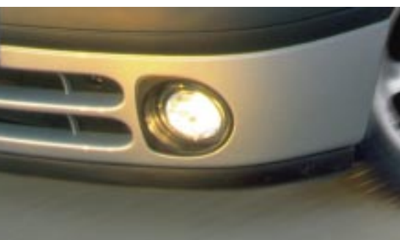
Nebelscheinwerfer Kompletter Satz inkl. Befestigungsmaterial. 77 01 410 517 429,90 DM · 219,80 €