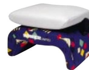
Sitz »Vario« Für Kinder von 3 bis 7 Jahren. Montage-Empfehlung: Rücksitz, vorzugsweise in der Mitte. 77 11 148 392 100,28 DM · 51,27 €