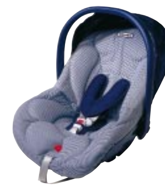
Sitz »Elios« Für Kinder bis 12 Monate. Montage-Empfehlung: Rücksitz, vorzugsweise in der Mitte. 77 01 416 298 215,76 DM · 110,32 €