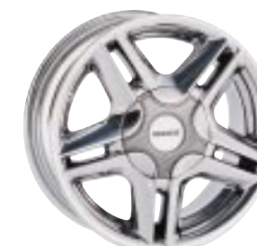
Design Monaco Chrom 6 x 14"