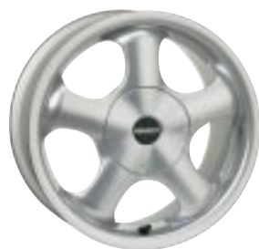
Design P-Line 6 x 14"

Leichtmetall-Komplettträder Design P-Line Plus Mit ABE. 6 x 15" mit Reifen 195/45 x 15. 77 01 381 541 484,88 DM · 247,92 € 6 x 16" mit Reifen 195/45 x 16. 77 01 381 542 515,04 DM · 263,34 €