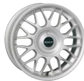
Design 2000 6 x 14"

Tieferlegungssätze Mit ABE. 1,2 l und 1,4 l Schaltgetriebe. 77 01 381 530 346,84 DM · 177,34 € 1,6 l Automatik und Diesel. 77 01 381 540 346,84 DM · 177,34 €