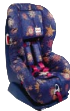
Sitz »Freeway« Für Kinder von 9 Monaten bis 3 Jahren. Montage-Empfehlung: Auf dem Rücksitz. 77 11 148 503 297,42 DM · 152,07 €