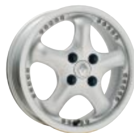
Design P-Line Plus 6 x 15" und 6 x 16"