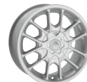
Design Saphir II 7,5 x 16"