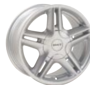
Design Monaco 6 x 14"